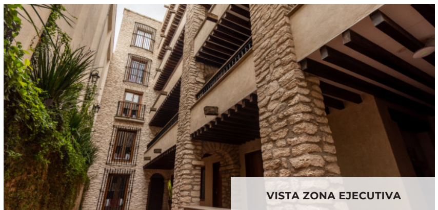
VISTA ZONA EJECUTIVA