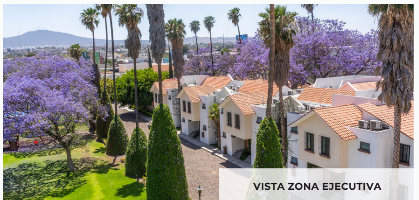
VISTA ZONA EJECUTIVA