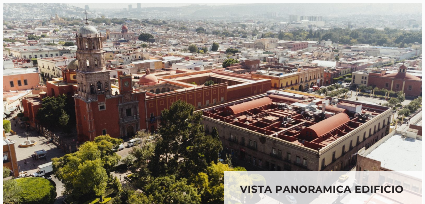
VISTA PANORAMICA EDIFICIO