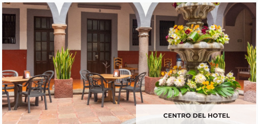
CENTRO DEL HOTEL