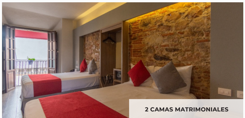
2 CAMAS MATRIMONIALES